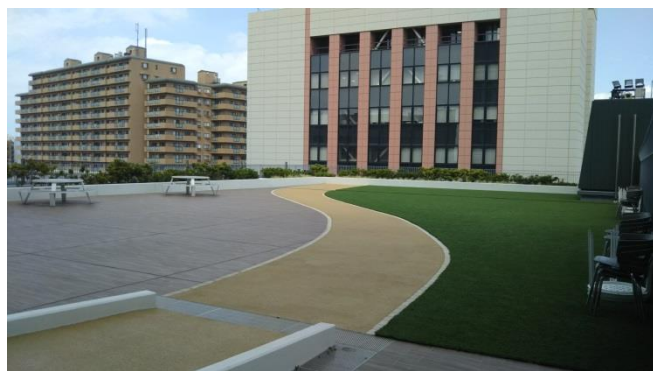
(3号館(種月館)5階「空のテラス」)

日程等、詳細が決定しましたら、各学部等事務室及びKONMAでお知らせいたします。