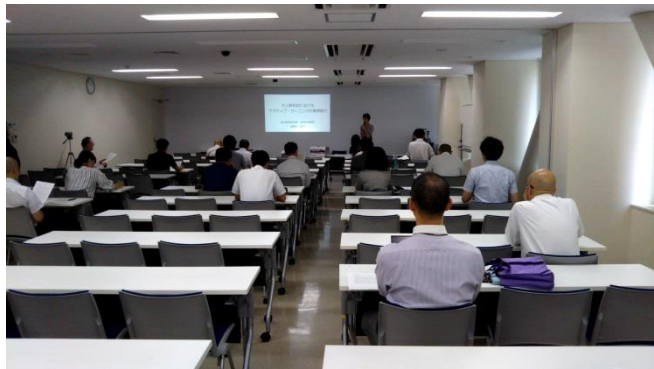
(第3回研修会の様子)

て、6割近い先生方が、人数にかかわらず試してみたい（または実践されている）とのご回答がありました。また、第1・2回を含め、学内の教員による事例紹介は参考になるとの意見が多くありました。