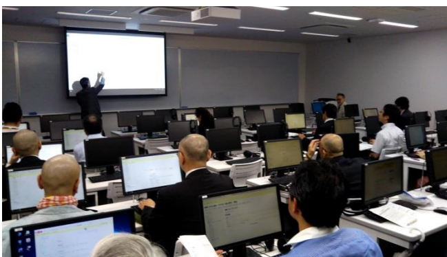
(第 1・2 回研修会の様子)

私はこの研修の後、担当している「コンピュータ基礎」でのビジネスメール作成課題および「新入生セミナー」でのプレゼン発表において、ルーブリックを作成し、事前にどういった評価軸になるかを学生に示したところ、どちらの講義でも 8~9 割の学生がルーブリックを参考にして課題などに取り組んだとのことでした（学生による授業アンケートにおいて「どの程度ルーブリックを参考にしたか」アンケートを行った結果より）。まだ 1 回しか試していないため、その効果は定かではありませんが、少なくとも自分たちがどのような評価軸で採点されるかを確認できることは、学生にとって一定のメリットはあるようです。また、研修会でも紹介されていたように、一度ルーブリックを作成してしまうと、評価作業はとても効率的に行う事ができました。今後、これらを改良しながらしばらく試行錯誤をしていきたいと思える手応えはあったように思います。