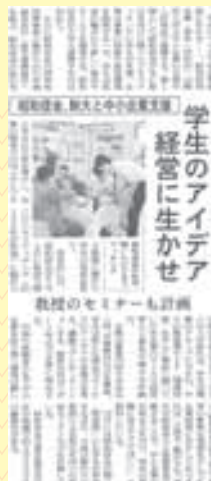
▲東京新聞 2012年6月9日(土曜日)より

双方とも初の産学連携協定締結となります。人材育成・教育支援・中小企業支援に関する業務を相互に連携して実施することにより、主に世田谷地域経済の活性化を目的としています。本学学生のアイデアが中小企業経営や商店街の地域ブランド創出に繋がることなど、多くの期待が寄せられています。（広報課）