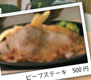
ビーフステーキ 500円