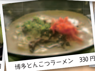
博多とんこつラーメン 330円