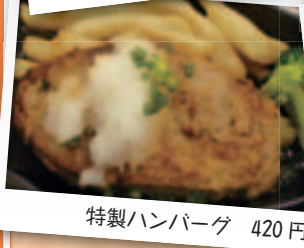
特製ハンバーグ 420円