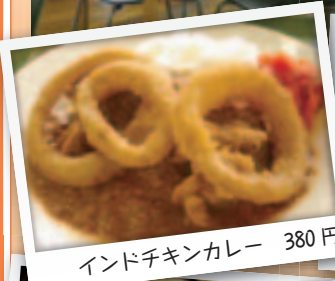
インドチキンカレー 380円