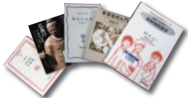
図書館の推薦する図書 21冊

今回は、各学部の先生方から新入生にお勧めしたい本をご推薦いただき、その中からさらに厳選した21冊をご紹介します。