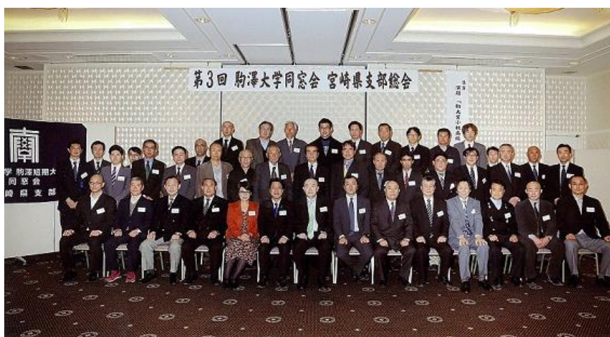
平成27年1月24日 第3回 駒澤大学同窓会 宮崎県支部総会