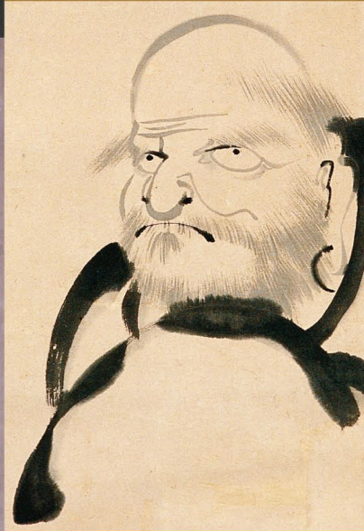
達磨図部分（左下：覚巖実明画賛、中上：北野元峰画賛、中下：靈潭魯龍画賛、右：瑞岡珍牛画賛） 当館蔵

新春の縁起物の象徴として、さまざまな姿で描かれた館蔵達磨図を展示するとともに、本学図書館に所蔵される達磨に関する資料を紹介します。